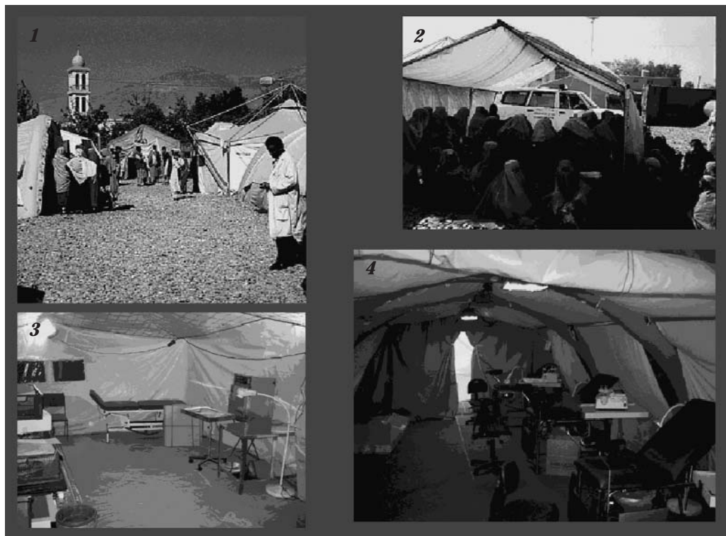
1. Hospitalet. 2. Venteværelse til fødestuen. 3. Interiør fra telthospitalet. 4. Interiør fra telthospitalet.

Der er til stadighed en stab af 8–10 dan-skere. Staben består af: en leder, en kombineret administrations- og kommunikationsmand, en anæstesisygeplejerske, en operationssyge-