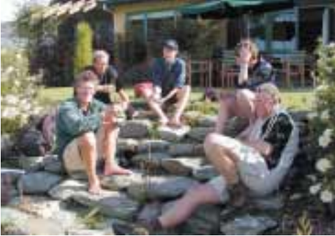
Gode new zealandske kolleger.

til at påskønne de danske arbejdstidsregler. I Dunedin er en weekendvagt fra fredag morgen til mandag morgen, efterfulgt af almindeligt arbejde til kl. 17.