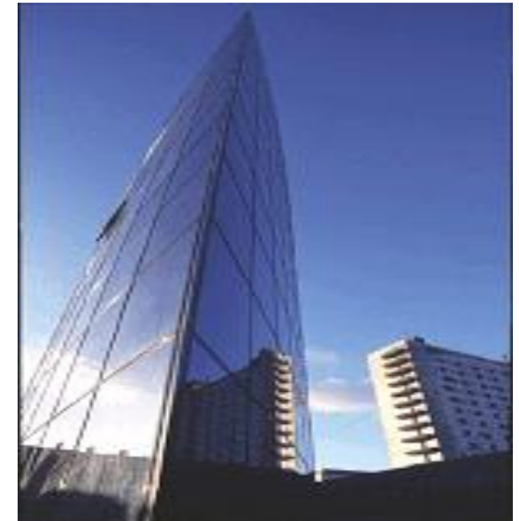
OUH Odense Universitetshospital