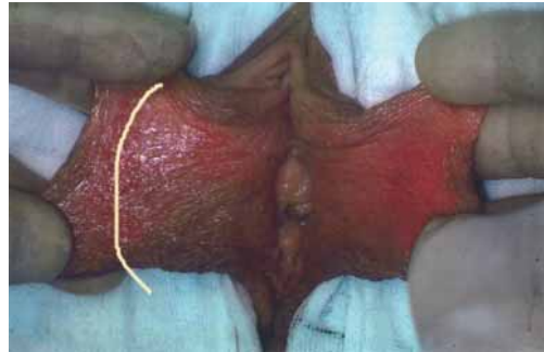
Fig. 2. Seglformet laserresektion.

Resektion af labia minora alene for at gøre dem mindre bør foretages som en seglformet