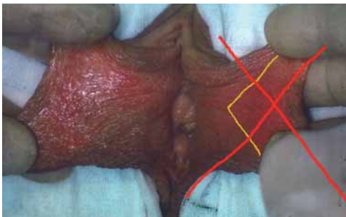
Fig. 1. Kileresektion af labium minus.